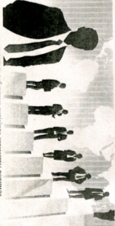
электрондық хабарлама негізінде автоматты режимде енгізілетін болды. Осылайша, акционерлік қоғамды, филиалды, өкілдікті

2019 жылдың 2 сәуірінде қабылданған «Бизнес - ортаны дамыту және сауда-саттық қызметін реттеу мәселелері жөніндегі Қазақстан Республикасының кейбір заңнамалық актілеріне өзгертулер мен толықтырулар енгізу туралы» Қазақстан Республикасының Заңымен коммерциялық ұйымдарда жататын заңды тұлғаларды, филиалдар мен өкілдіктерді мемлекеттік тіркеу функциясы