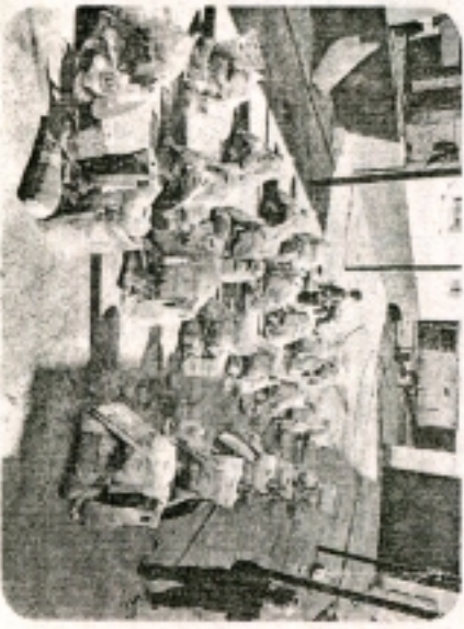
Білетін міндет - барша жандарды жақсылық жасауға шақыру,- дейді

қыстау сәтте көмек көрсеткен жандарға баршамыз бірге алғыс айтамыз! Қыс мезгілі тапп қалған шақта көмек қолын созған жандарға көмек алған отбасылар Дархан Дүйсебеков бастаған ұжымға «Алла разы болсын!» - деген алғысын жеткізуде.